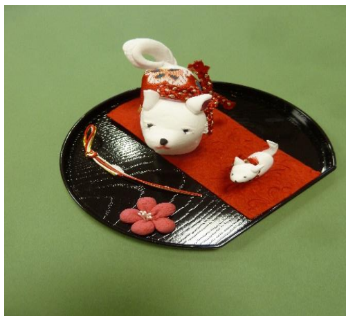
ほっと事業「樹脂粘土 干支作り」