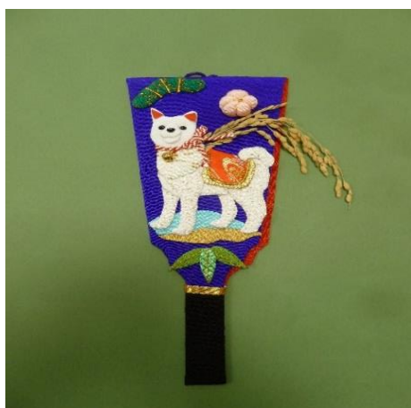
ほっと事業「羽子板」